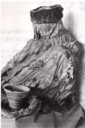
COYO ORIENTE, Tumba 4129.