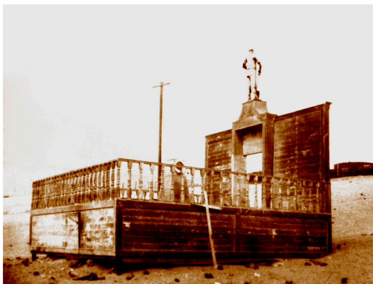
Figura 2. El Mausoleo de los Mártires de la Plaza Montt.

Incluso este autor se pregunta: “en esta cultura obrera oficial de tiempos del centenario ¿qué sentido tienen los mausoleos obreros?” (1987:203). Puede ser una pregunta válida para algunos mausoleos obreros, en cambio, para el que fue construido en el cementerio N° 2, en el lugar donde fueron lanzados los cuerpos de los asesinados responde al imaginario que los pampinos tenían de lo que era una tumba. Posiblemente, los hombres y mujeres de la pampa han tenido conciencia de trascendencia que permite el desierto al momificar naturalmente a los cuerpos. Sea una fosa común, una simple tumba o un mausoleo de madera, son lugares de memoria para los habitantes del desierto, lo que está más allá de la problemática ideológica e ilustrada de un movimiento obrero. Los dirigentes de la huelga eran obreros ilustrados algunos, anarquistas o socialistas, no todos fueron pampinos, porque en los días previos se unieron los de la pampa y el puerto en un único comité de huelga, compartiendo los cargos directivos, en cambio, la gran masa superior de diez mil personas llegó procedente de las oficinas salitreras.