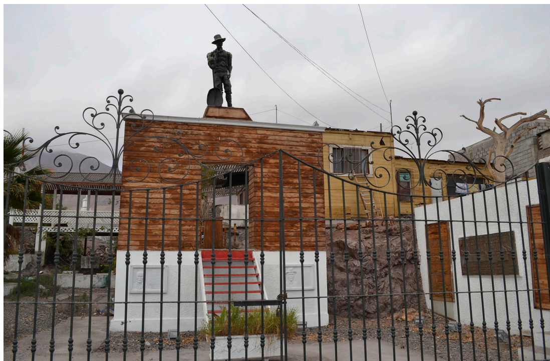
Figura 3. Réplica del Mausoleo de los Mártires de la Plaza Montt.

El diario La Tercera del 4 de marzo de 2007, p. 30, incluía un reportaje donde se entrevista al trabajador del cementerio N° 3, Daniel Mancilla,