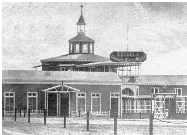
Figura 4. Escuela Santa María de Iquique.

En definitiva, la pregunta es ¿qué nos quedó después de este episodio trágico de la historia de Chile? Nos quedan los imaginarios, sus respectivos rostros, su legado, su honor y rabia, los discursos plasmados en múltiples relatos, como también su